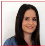
Gülsah Sagir Verwaltung