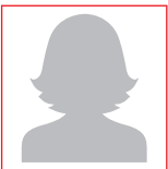
Djedije Sabani Raumpflege