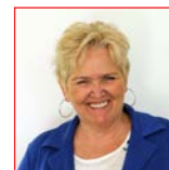
Barbara Gorel Taschengeldbörse