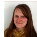
Verena Mrzigold Beratung