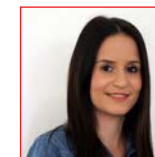
Gülsah Sagir Verwaltung